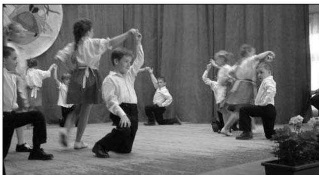
Dány Napközi Otthonos Óvoda