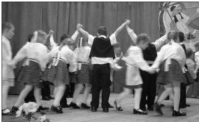
Csömöri „Kiscsicsörke” Gyermektánc Csoport