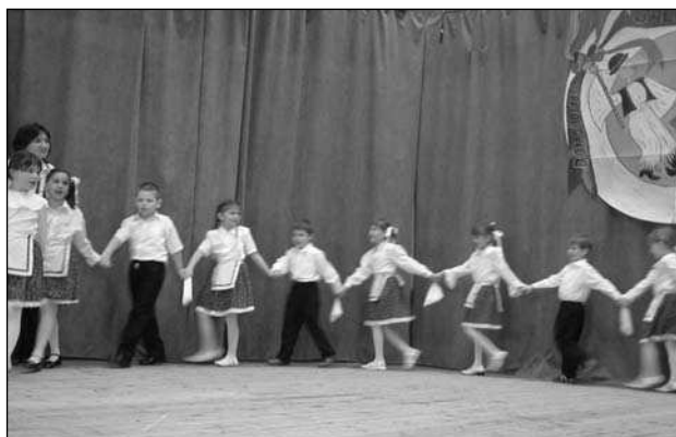
Kiskunlacháza – Áporka Óvodai Társulás, 1.sz. Óvoda Napsugár Csoport