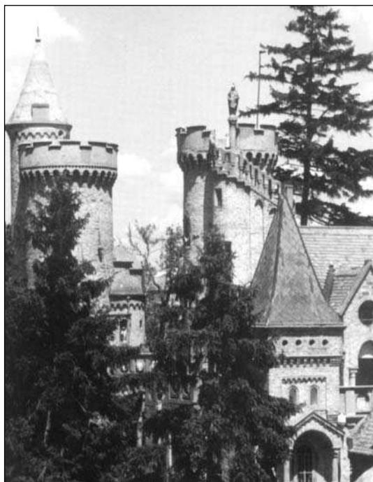
A Bory vár

Szóval az volt a kérdés, hogy mivel foglaljuk el magunkat az eredményhirdetésig. Végül kitaláltuk, hogy meglátogatjuk a Bory várat, Székesfehérvár egyik nevezetességét. Nem bántuk meg, mert egy tüneményes váracska, amelyet egy szobrászművész tervezett és épített. Szép szobrai is itt láthatók, igazán termékeny művész volt. Mindenkinek ajánlom figyelmébe ezt a kis várat, aki Fehérvár felé jár.