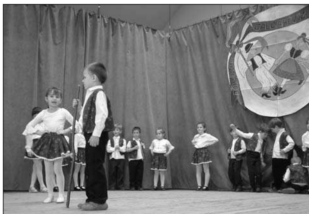
Veresegyházi 2. sz. tagóvoda, középső csoport