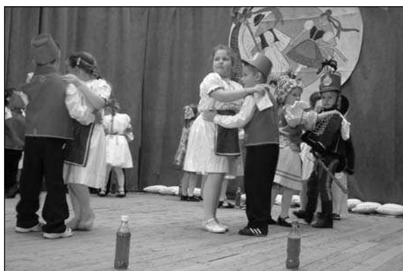
Boldogi Napközi Otthonos Óvoda

„Külön érdem, ha valaki a saját falujának hagyományából emel ki dalt, szokást, gyermekjátékot és azt 'viszatanítja' az ugyanabban a társadalomban, környezetben felnövekvő gyermekeknek.”