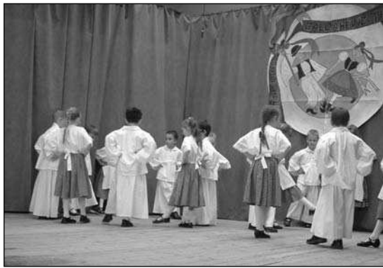
Szada Napközi Otthonos Óvoda Gomba Csoport