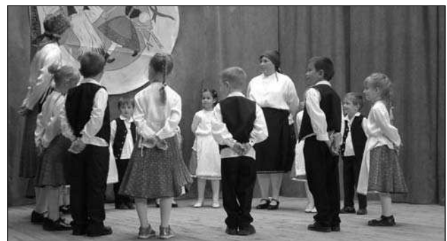
Kartal Játéksziget Napközi Otthonos Óvoda