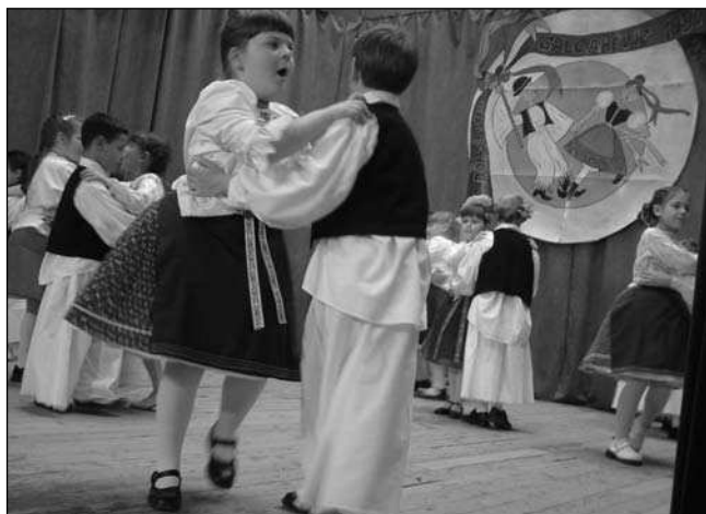
Pest Megyei Óvodás Néptánc-találkozó Galgahévízen (3. oldal)

Időközben azonban beköszöntött a május, és első vasárnapja elhozta az Anyák Napját. Ajánljuk figyelmükbe a szalvatoriánus atyák e témában írott szívhez szóló írását.