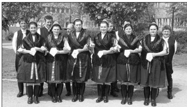
Az arany fokozatot elért Hagományőrő Együttes Székesfehérváron (11. oldal)