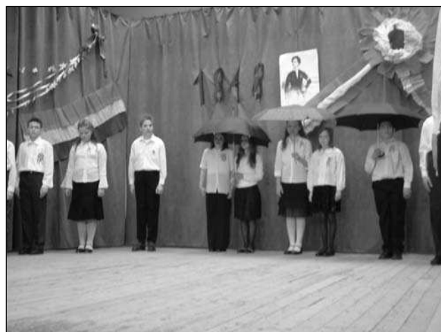
Az 5. osztályosok a színpadon