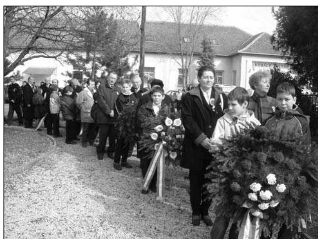
A művelődési házból átvonultunk a Hősök szobrához koszorúzni