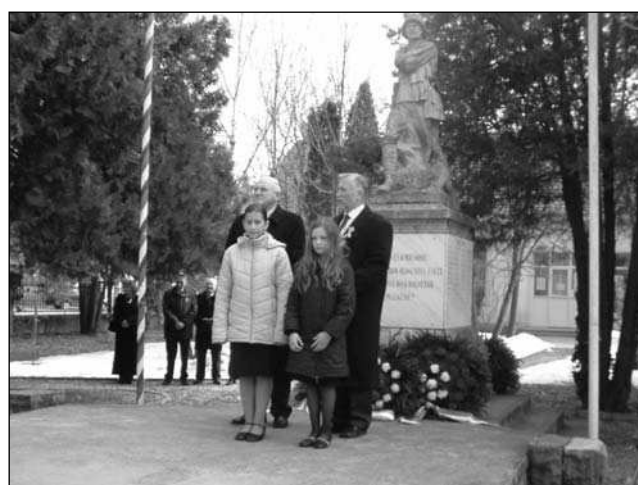
... és a Szózatot közösen elénekelve véget ért a koszorúzás