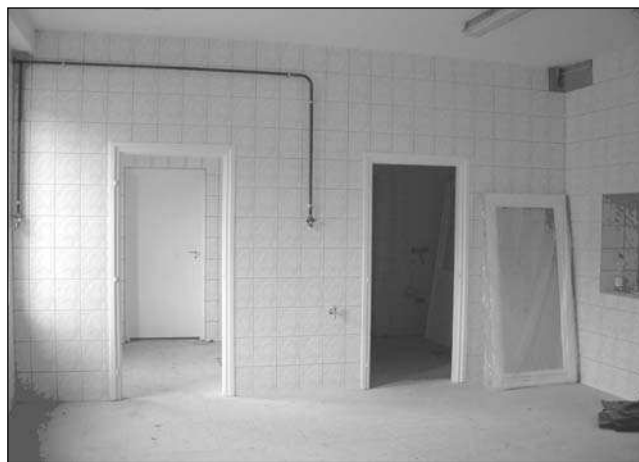
Munkára kész az új ovi konyha