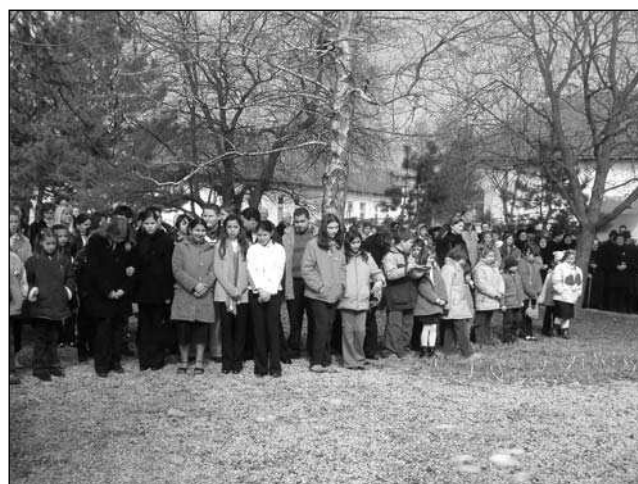
A Főtér megtelt...