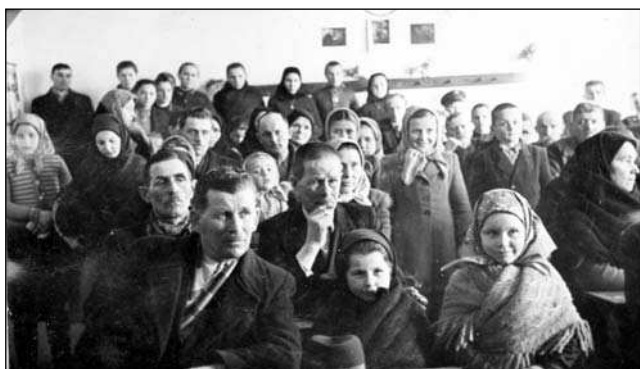
Taggyűlés az ötvenes években

Az előző elbeszéléseim története a ma élő emberen keresztül életünk, az egész község lakosságának javára, eredményes fejlődést, gazdasági fellendülést ígért és igyekezett megvalósítani. Terveinket azonban beárnyékolták azok a felsőbb, központi intézkedések, amelyek nem mindig találkoztak, és nem számoltak a helyi és akkori lehetőségekkel és megtermelhető javakkal. Mind több és többet vontak el a tagoktól, a lakosságtól, ami sok értetlenséget, nemtetszést szült. Bár az akkori kormány eleget téve az országos lakossági követelésnek, hogy bizonyos drasztikus, erőszakos kollektivizálási eljárásokat, valamint a kötelező beszolgáltatást szüntesse meg. Ezek a követelések ideiglenesen eredményhez vezettek. A gomolyfelhő a kezdeti időben falunk felett is oszlani látszott, de egy év elteltével súlyos viharfelhővé változott. Az 1956-os forradalom szele falunkat is elérte. Hogy ki, milyen álláspontot foglalt el és foglal el ma is, azt a történészek és a ma még élő ember feladata tisztázni. Községünk felnőtt lakossága és vezetői akkor is bölcsen, előre látóan döntöttek. Nem engedtek a szélsőséges, és az akkori divatos felforgató, az embereket egymásnak uszító propagandának.