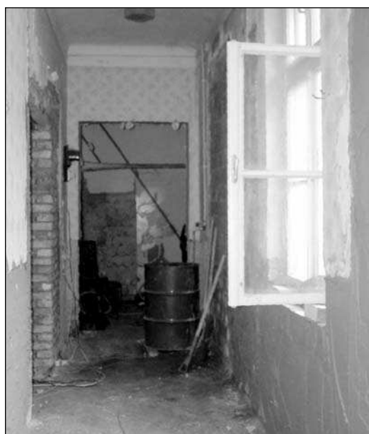
Megkezdődött az ovi felújítása