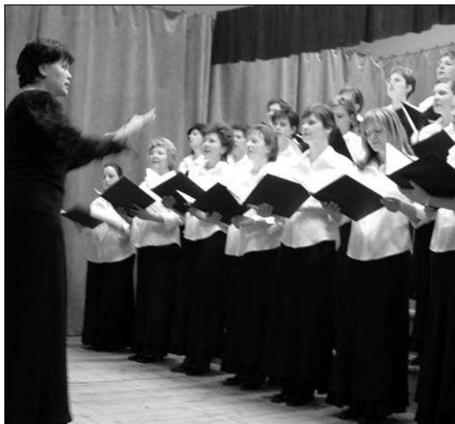
Péntek esti főpróba a kórus új egyenruhájában

Ez a kórustalálkozó jó lehetőség volt arra is, hogy a kórusok és a vezetők megismerkedjenek egymással. Jóleső érzés volt, hogy olyan szépnek találták dalainkat, hogy többen is kértek belőlük másolatot, mert minél hamarabb szeretnék ők is betanulni azokat. Sokan gratuláltak nekünk, és kifejtették a kórusvezetők közül, hogy Galgahévíz Női Kara gyönyörű hangszínnel, tisztán, kidolgozottan énekelt. Neves kórusok vezetőitől is nagyon jólesett a dicséret. Kritikát nem kaptunk – még építő jellegű kritikát sem. Mi is éreztük a közönség szeretetét.