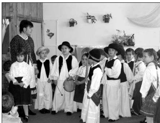
Ez a lábam ez-ez-ez, jobban járja mint emez. Édes lábam jól vigyázz, mert a másik meggyaláz! Sok örömet e házban, boldogságot családban.