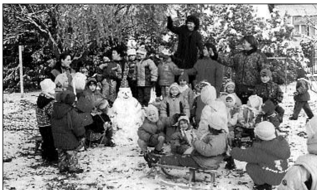
A tavalyi hó az idén csak mesebeli álom. S ha az álom valóra válik, a dombocská teletején szánkóznunk majd Te meg Én.