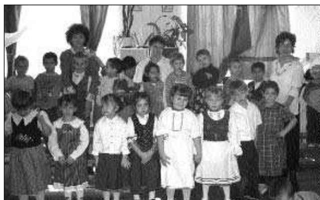
Kicsik vagyunk, láthatjátok kicsi fiúk-lányok. Nem pacsirták, nem is rigók, cinkék-csalogányok! Együtt vagyunk egész nap, itt az óvodában. Este pedig otthonunkban, ki-ki családjában!