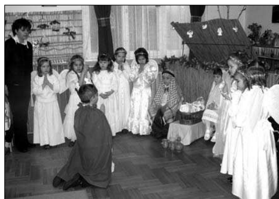
Karácsony napja örömnép, mi Urunk Jézus megszületett. Öröm van a mennyekben, öröm itt a szívünkben, hogy a Miénk lett.