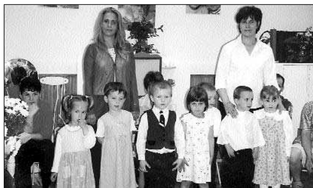
Néked zeng ez a dal, szívünk Téged ünnepel ma. A hangok szárnyra kélnek, tengernyi szépet, jót kívánva Néked! Tengernyi szépet, jót kívánva Néked!