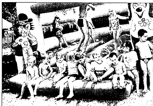
4. Mesevárban de csodás! Jó magasra ugrani és nagyokat huppanni!