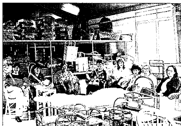
6. Jól érezzük magunkat Tiszaalpáron a természetes anyagok világában.