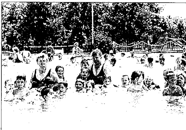
3. Nagykátán élvezzük a strandot, "ottan annyira szép és jó..."