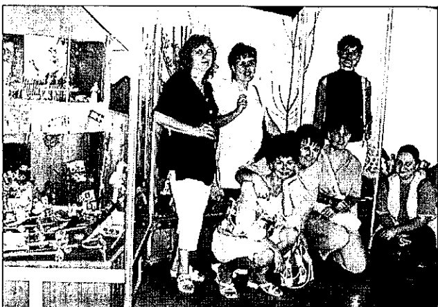
5. Nostalgia Kecskeméten, a Szórákaténusz Játékmúzeumban.