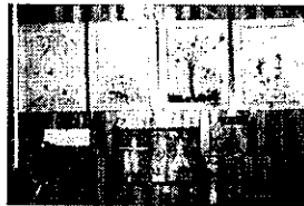
Aszód, Napsugár Óvoda munkája