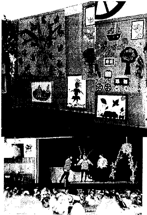
A természetes anyagokból készült kiállítást az óvónők mesejátéka színesítette

Azután jött a várva várt mese: "Az aranyos tarajos kiskakas" c. előadás.