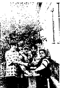
Munkában a 8. osztályosok