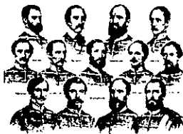
Az aradi tizenhárom

Megdől a szabadság végső reménysége. Halálra vérzik immár Magyarország. A leverett szabadságharc immár fegyvertelen híveinek sorsa, az osztrák császári önkény kezébe került, és minél nehezebbek és megalázóbbak voltak, a csak cári fegyverek segítségével kivívott győzelem körülményei, annál megokoltabbnak és szükségesebbnek tűnt Bécs számára a könyörtelen bosszú.