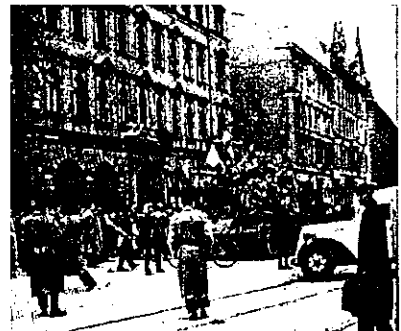
Budapest, 1956. október végén

Golyóverte testünk lankadó lankái holt anyaggá hűlnek, gránátot markoló kimarjult karjaink jégge merevülnek. ...Sebeink nyitottak, nyírkos kövön fekszünk, most már nem verekszenk. Égő, túlvilági benzines palackok lángjánál melegszenk.