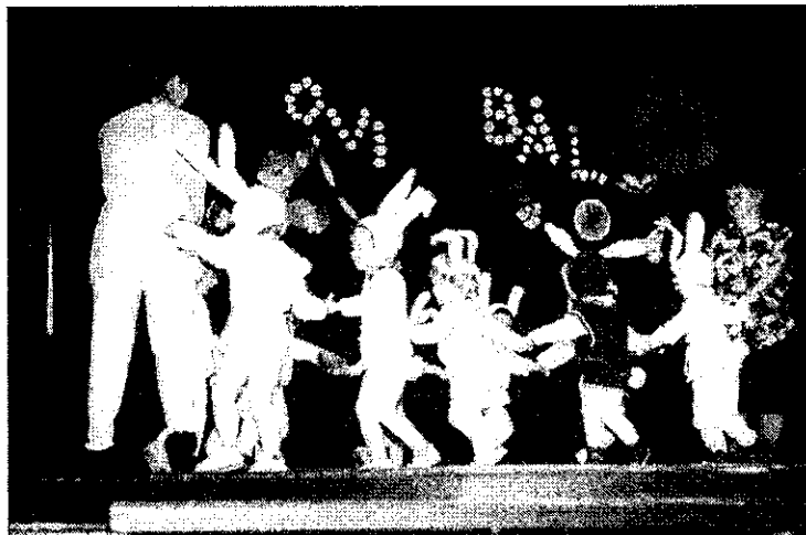
Farsangolunk, vigadunk, együtt táncolunk!

A délutáni játékot egy csodálatos szülő-gyermek-óvónő közös együttléte előzte meg. A gyermekek játéka közben a szülők az óvónők segítségével gyönyörű,