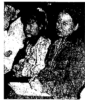
Minden korosztály jelen volt a közmeghallgatáson