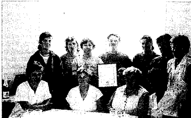
Az óvoda kollektívája az elismerő oklevéllel