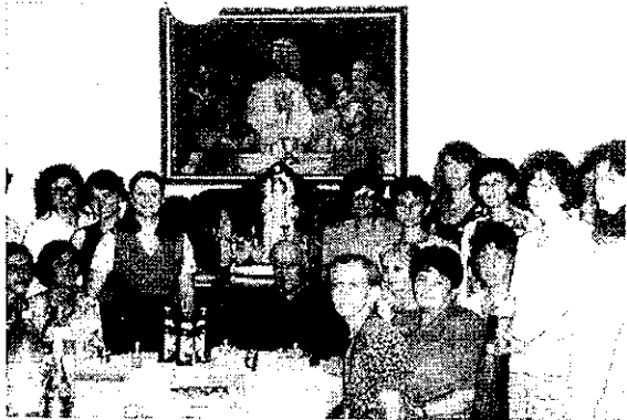
Prépost úr a hagyományörző tábor vendégeivel