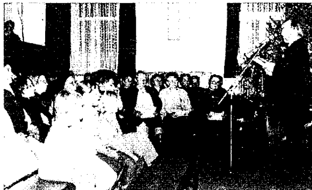
Dr. Basa Antal polgármester köszönti a jelenlevőket.