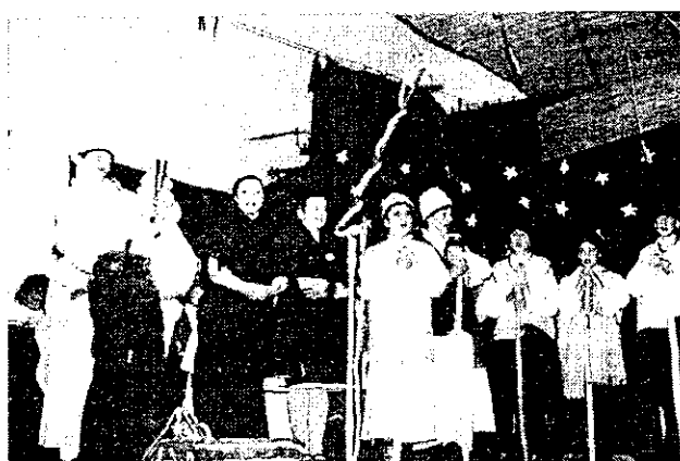
Regősök jó kívánságai