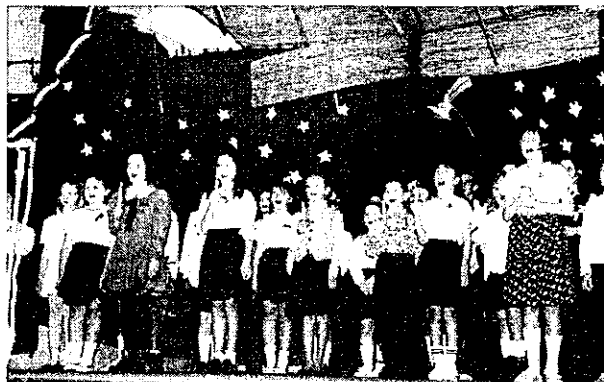
... Szent Karácsony eljött az ég a földre szállt...