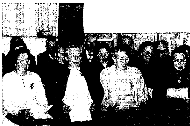
Nyugdíjas Klub énekkara