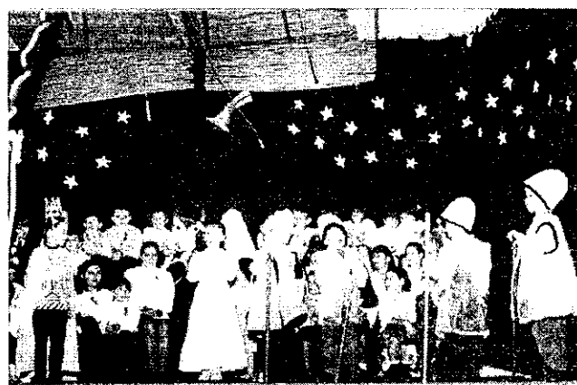
Ovisok betlehemes jelenete