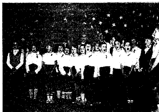
...Áldott minden ember áldott...