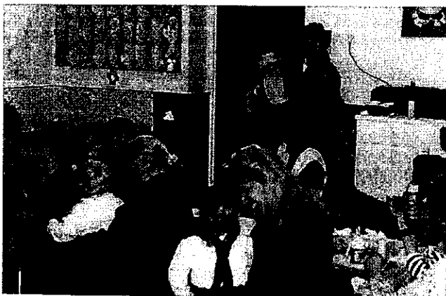
Mikulás érkezik a Baba-Mama Klubba

Várunk mindenkit Ovisok és vidám Névelők