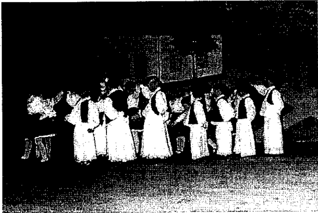
Galgahévíz „játékos diplomatái” a színpadon. Civilben ők a nagycsoportos ovisok!

... lehet a falu az óvodájára ... lehet az óvoda a vezetőjére ... lehet a vezető a munkatársaira