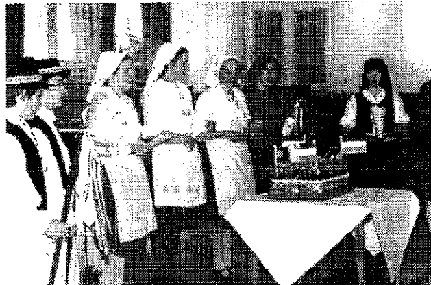
„Meghoztuk a menyasszony kalácsot” (8-an 4 nadrágban csapat)