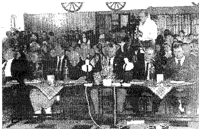
A zsüri és a közönség elfoglalta helyét, kezdődhet a döntő