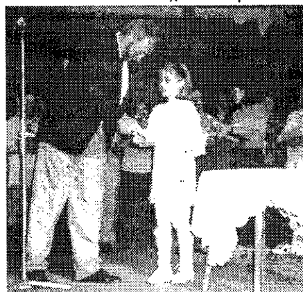
A zsüri elnöke a legfiatalabb versenyzőt köszönti