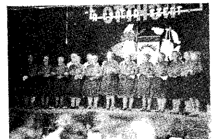
A közösséggyőztes Nyugdíjas Klub