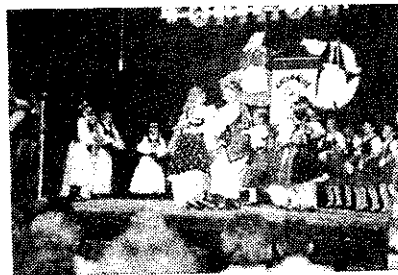
Lendület – fiatalság – fergeteg a gyermekcsoport előadásában