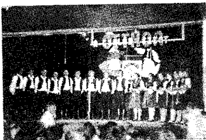
Galgahévízi dallamok a Pávakör előadásában