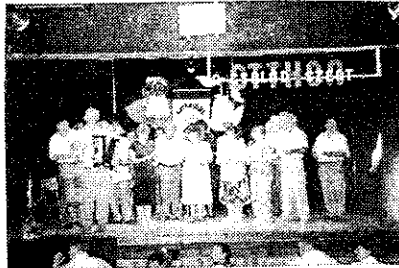
A Tonnenheidiek fellépése a Tanár Úr vezetésével