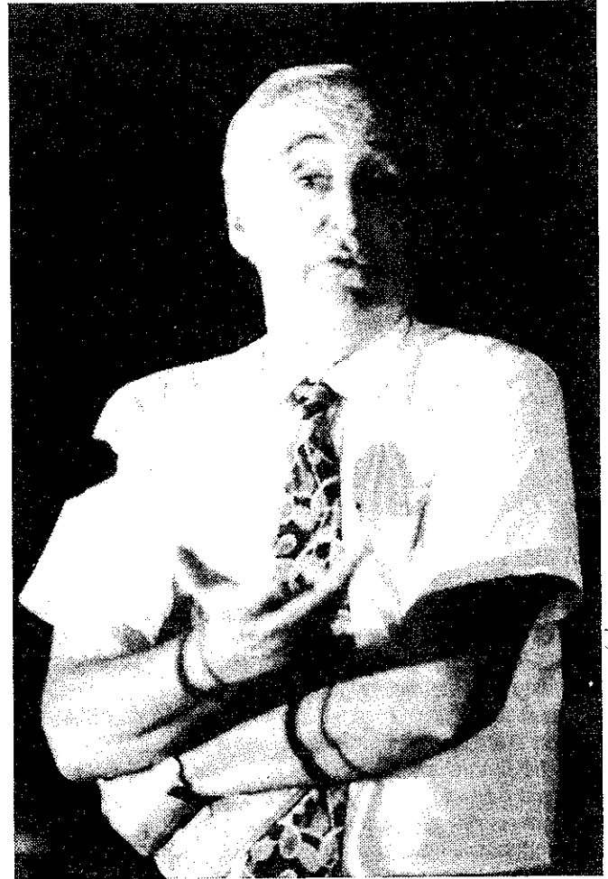
Czeizel Endre: Az ember tehetlenebbnek, gyengébbnek születik más élőlényeknél, ezért van szüksége a családra