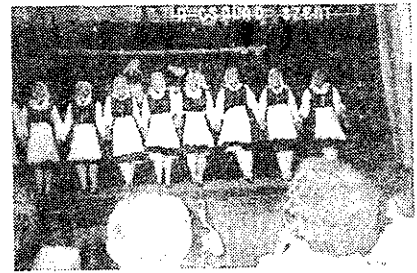
A „Komámasszonyok” ének és tánc közben