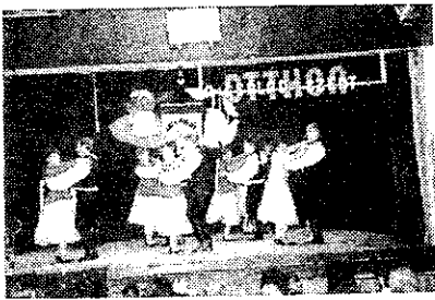
A kikindai fiatalok páros tánca