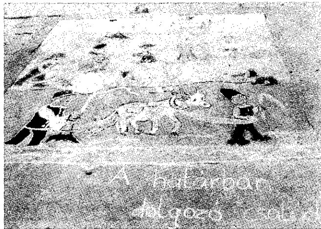
Az ifjúsági vetélkedő egyik feladata két négyzetméteres aszfaltrajz készítése volt a galgahévíziek múltjáról