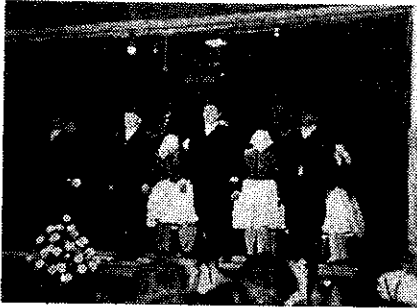
15 évvel előtti fiúcs- kák férfivá érettek