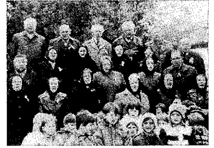
Generációk együtt Kossuth nótákkal az ajkukon

„... Rabok legyünk vagy szabadok, Ez a kérdés, választatok...”