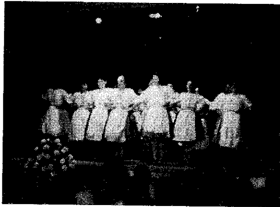
A lánykaréj, akik biztos pontjai voltak az együttesnek