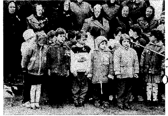
Lenkel századjánál mesélnék a 2. osztályosok