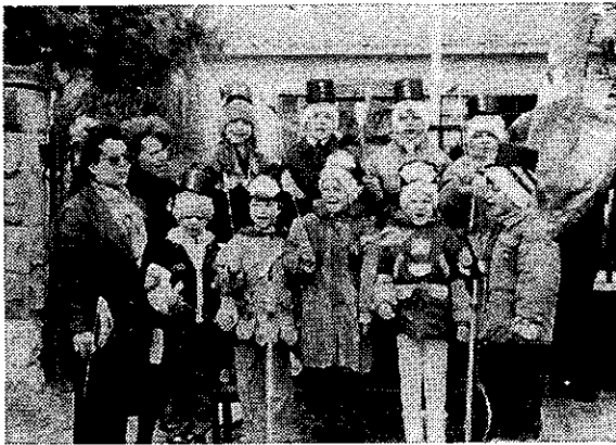
Tavaszt, jövőt köszöntő Ifjú nemzedék

„... Rabok legyünk vagy szabadok, Ez a kérdés, választatok...”