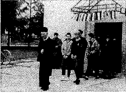
Ünnepi szentmise után került sor a hősi emlékműnél a megemlékezésre