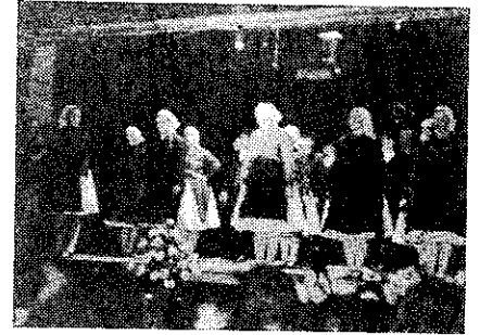
A már "Idesanyák" is megállják helyüket a lányok között