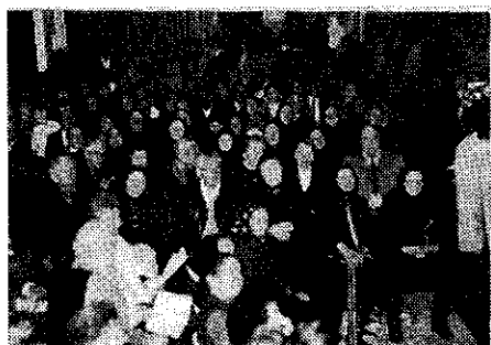
A Nyugdíjas Klub Énekara és a műsor hallgatói