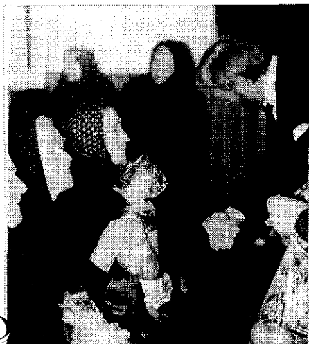
A Polgármester úr megajándékozza a 70 éven felüli nyugdíjasokat