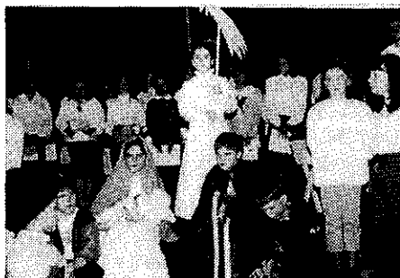
Az iskolai énekkar és a 3. osztályos tanulók Betlehemes játékának előadása