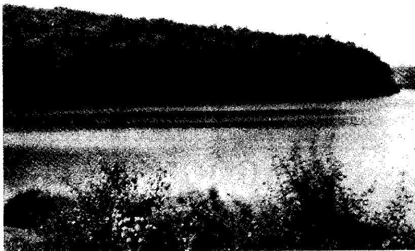
A tervezett helyszín

Eddig a pontig minden szép, világos, áttekinthető. Ezután azonban meglehetősen összegabalyodnak a szájak. A célnak megfelelő tóparti terület ugyanis a turai székhelyű, mamut termelőszövetkezet birtokában van. Az első pillanatban a tsz felajánlotta a célra az öt hektárt, de a tényleges átadás várattott magára. Egy falugyűlésen a szövetkezet elnöke ígéretet tett a falu előtt, hogy belép a földdel a formálódó részvénytársaságba. Néhány nappal később azonban — bizonyos banki tárgyalások után — megváltoztatta döntését, s már csak eladásról volt hajlandó tárgyalni. Ezt követően olyan elképzelés született, hogy önkormányzati tulajdonú földekkel váltanák ki a szövetkezet által birtokolt területet, de ennek a lépésnek sem terem-